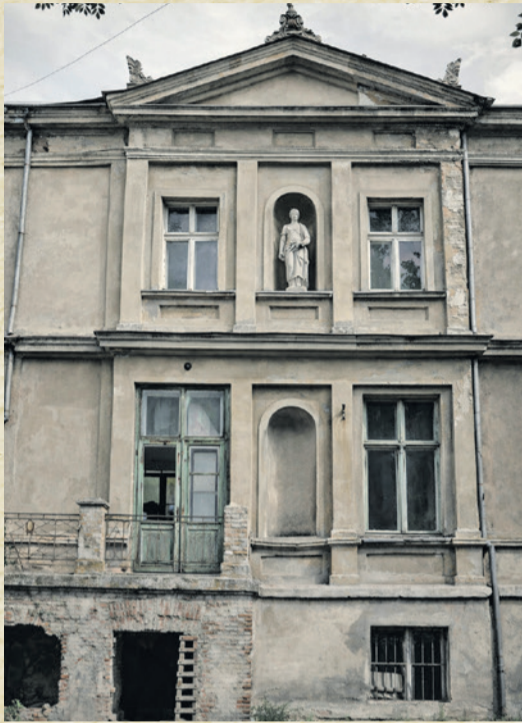
Fot. Pałac w Sarnowie / WUOZ Poznań

Grodzisko posiadało formę grodu stożkowego (o czym świadczy pozostałość o charakterze wzniesienia), niegdyś najpewniej otoczonego fosą oraz wałami drewniano - ziemnymi. Jak już wspomniano, przez wieki działało ono jako miejsce stacjonowania wojsk książąt.