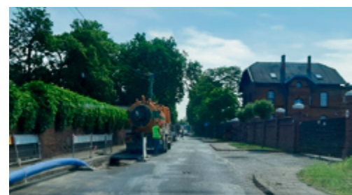
Prace związane z przebudową sieci wodociągowej potrwać do końca czerwca na ul. Targowej, od początku lipca rozpoczną się na ul. Wały Poniatowskiego.