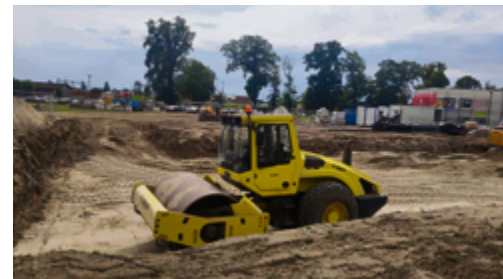
Budowa żłobka w Rawiczu - po przekazaniu placu budowy wykonawca niezwłocznie rozpoczął roboty budowlane.