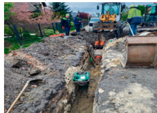
Przebudowa ulicy Szczęśliwej w Rawiczu - zakończono budowę kanalizacji deszczowej, wykonawca kończy prace związane z budową sieci teletechnicznej.