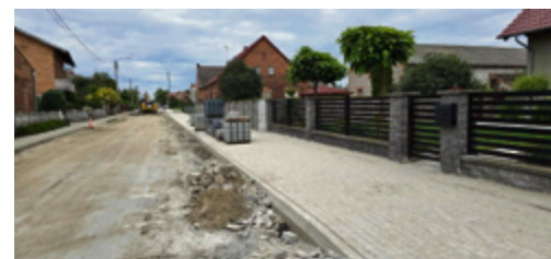
Przebudowa drogi gminnej w Izbicach - trwa układanie nawierzchni ścieżki pieszo-rowerowej.