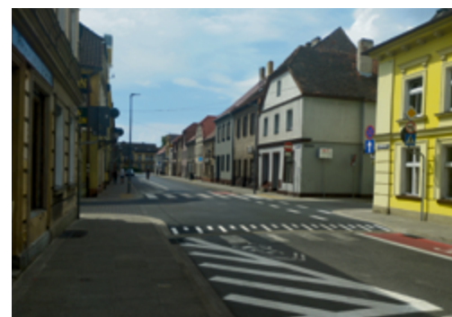
Zakończono prace budowlane przy budowie bezpiecznego przejścia dla pieszych w ul. Grunwaldzkiej w Rawiczu przy skrzyżowaniu z ul. Marcinkowskiego.