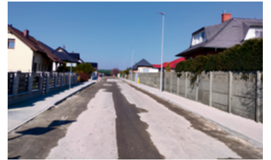
Przebudowa ul. Żniwnej w Masłowie - zakończono budowę sieci wodociągowej, trwa realizacja zakresu drogowego.