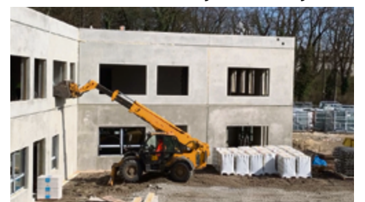
Budowa przedszkola w Rawiczu - zakończono montaż ścian zewnętrznych i stropów, wstawiane są okna.