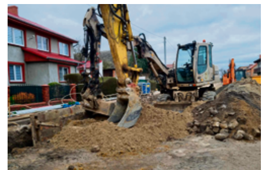
Przebudowa drogi gminnej w Izbicach - zakończono budowę kanalizacji deszczowej, trwa budowa kanalizacji sanitarnej.